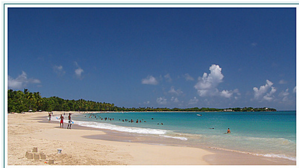
Plage des Salines