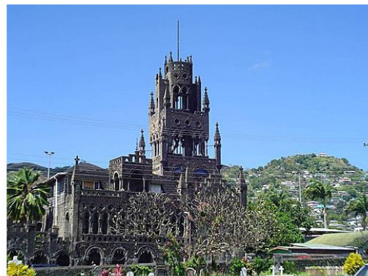
Very old building on Saint Vincent Island